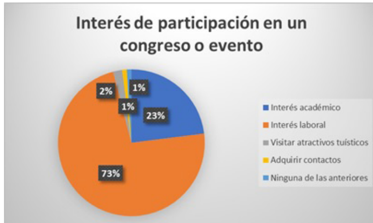
Figura 2. Interés por participar en un evento. Elaboración propia basada en las encuestas a los visitantes.

El 58% manifestó que solo cuenta con cuatro horas de tiempo disponible antes de regresar a su lugar de origen, eso significa que no posee mucho tiempo para desplazarse a otro destino, por ende, es importante que las empresas turísticas aprovechen esa oportunidad para promocionar los atractivos turísticos y captar el interés del visitante para que se decida en conocer los puntos turísticos más importante de la ciudad. Figura 3