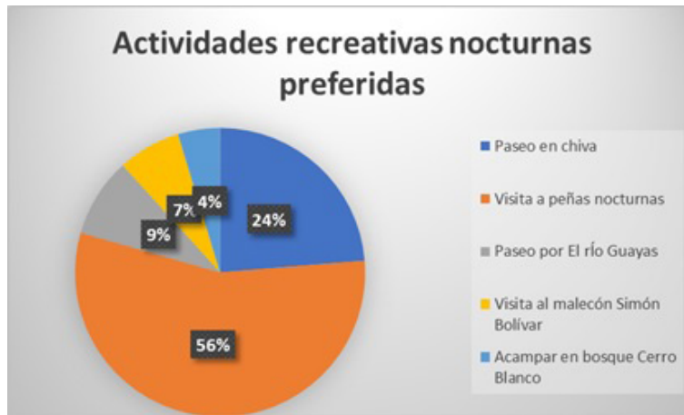
Figura 8. Actividades recreativas nocturnas preferidas después del evento o congreso. Elaboración propia basada en las encuestas a los visitantes.

Con esta información es necesario ejecutar una triangulación de resultados y hechos que demuestran la importancia del porqué, la ciudad de Guayaquil requiere del uso de sus recursos para fortalecer el turismo interno, modalidad atractiva y creciente relacionada al turismo de eventos y reuniones, que se manifiesta poco pero que puede ser impulsado con una buena organización local.