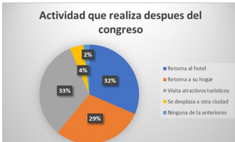
Figura 4. Actividades que realizan después del congreso o evento. Elaboración propia basada en las encuestas a los visitantes.

El 46% manifestó que probablemente si estarían interesados en desarrollar actividades recreativas, siendo así, es de suma importancia contribuir con nuevos diseños de circuitos turísticos urbanos para mejorar el desarrollo de actividades recreativas que involucren la participación del visitante, y como si fuera poco el 46% de la población está totalmente de acuerdo en desarrollar actividades recreativas en la ciudad de Guayaquil. Figura 5