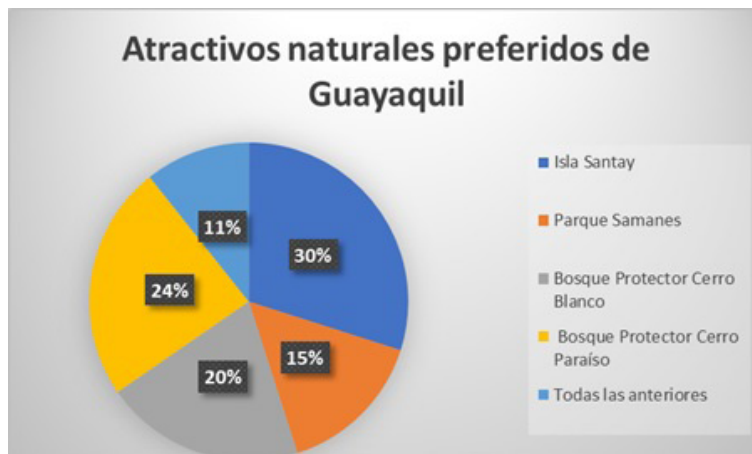
Figura 7. Atractivos naturales de la ciudad de Guayaquil preferidos para desarrollar actividades no incluidas en las jornadas de congresos o eventos. Elaboración propia basada en las encuestas a los visitantes.

Aunque los encuestados manifestaron que les agrada visitar recursos naturales en igual preferencia que los históricos y culturales, consideraciones que otorgaron a la Isla Santay el 30% de aceptación de entre las otras áreas naturales que sin diferir mucho en porcentajes también tienen aceptables porcentajes de aceptación. Figura 7