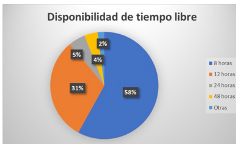
Figura 3. Disponibilidad de tiempo libre después de cumplido el congreso o evento. Elaboración propia basada en las encuestas a los visitantes.

El 58% manifestó que solo cuenta con cuatro horas de tiempo disponible antes de regresar a su lugar de origen, eso significa que no posee mucho tiempo para desplazarse a otro destino, por ende, es importante que las empresas turísticas aprovechen esa oportunidad para promocionar los atractivos turísticos y captar el interés del visitante para que se decida en conocer los puntos turísticos más importante de la ciudad. Figura 3