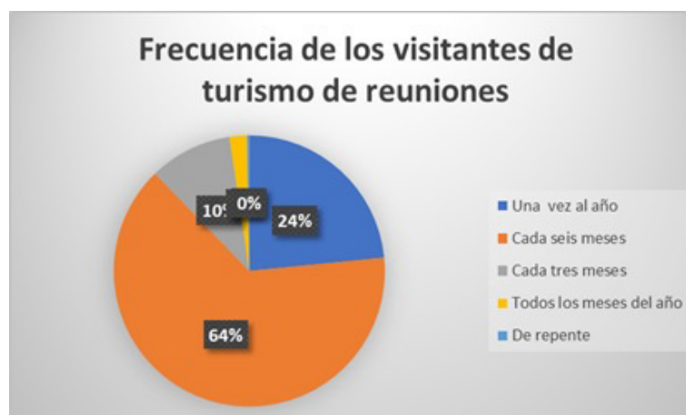
Figura 1. Frecuencia de los visitantes de turismo de reuniones. Elaboración propia basada en las encuestas a los visitantes.

Los turistas encuestados ofrecieron datos significativos que demuestran que existe un desaprovechamiento de los recursos con los que dispone la ciudad, pues ellos en un 64 % de manifestó que acude a la ciudad de Guayaquil cada seis meses para asistir a congresos o participar como expositor durante una conferencia, eso significa que este tipo de turista viaja dos veces al año a Guayaquil desembolsando cierta cantidad de dinero en transporte, hospedaje y alimentación, por lo que es necesario aumentar su gasto mediante un cronograma de actividades turísticas que permita generar nuevas fuentes de ingreso para la ciudad de Guayaquil. Figura 1