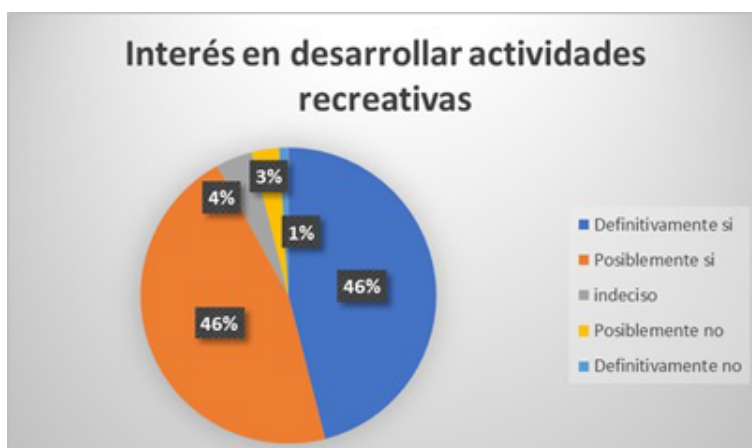
Figura 5. Interés en desarrollar actividades recreativas fuera de la jornada de eventos. Elaboración propia basada en las encuestas a los visitantes.

El 46% manifestó que probablemente si estarían interesados en desarrollar actividades recreativas, siendo así, es de suma importancia contribuir con nuevos diseños de circuitos turísticos urbanos para mejorar el desarrollo de actividades recreativas que involucren la participación del visitante, y como si fuera poco el 46% de la población está totalmente de acuerdo en desarrollar actividades recreativas en la ciudad de Guayaquil. Figura 5